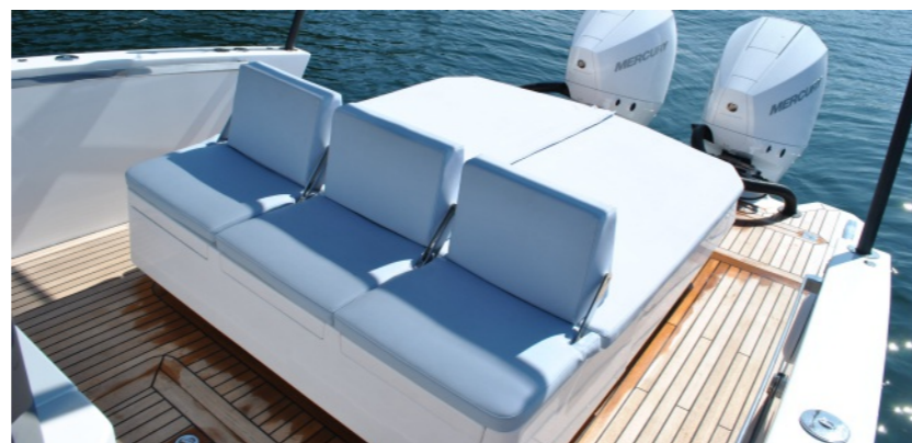
Solarium para 3 personas