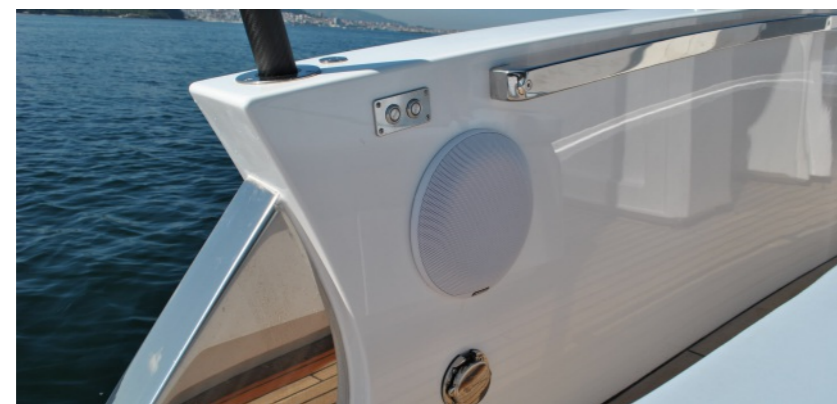
Sistema de sonido HI-FI 4.1