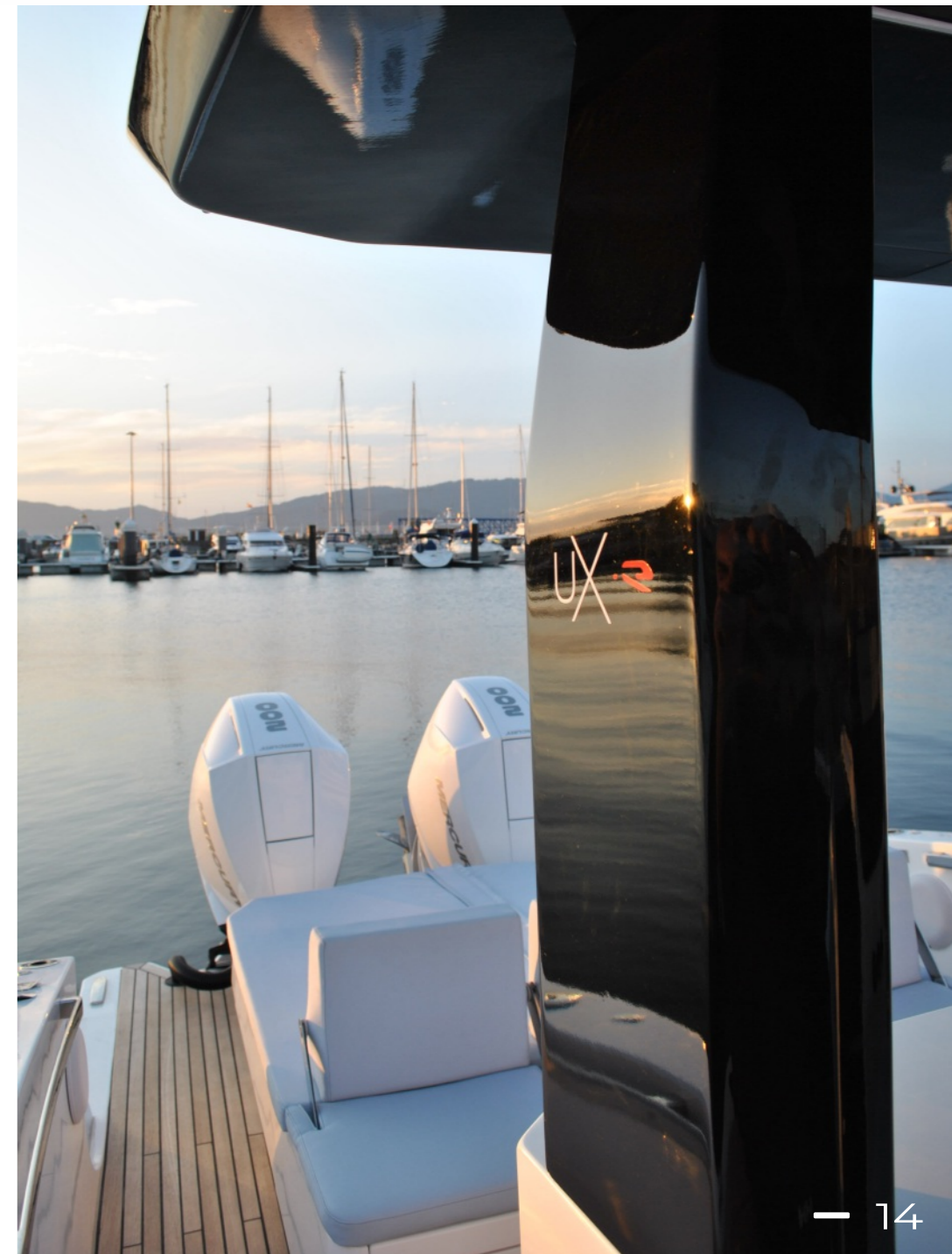
Hard-Top de fibra de carbono