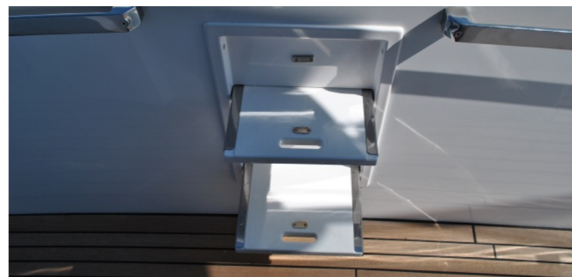
Escalera de acceso lateral