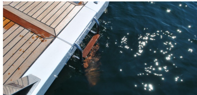
Escalera de acceso a plataforma de baño