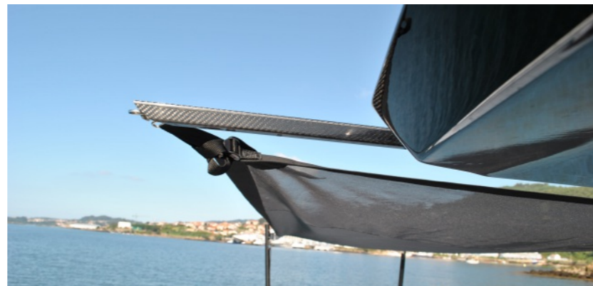
Sistema de toldo retráctil

Ha sido diseñado con todo lujo de detalles premiando siempre la habitabilidad y comodidad.